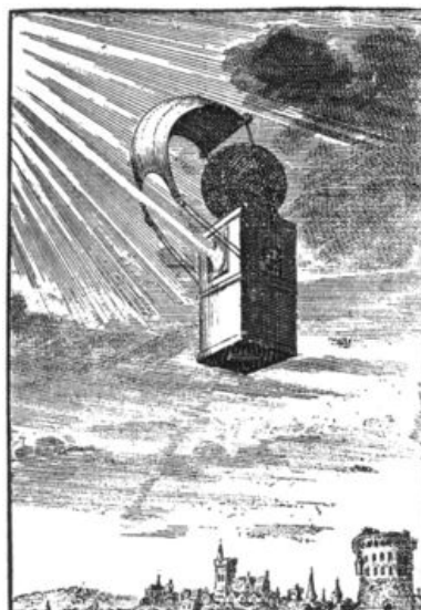
Illustration de l'édition originale 1662

« Quand le crime d'un coupable est jugé si énorme, que la mort est trop peu de chose pour l'expié, on tâche d'en choisir une qui contienne la douleur de plusieurs, et l'on y procède 25 de cette façon : Ceux d'entre nous qui ont la voix la plus mélancolique et la plus funèbre, sont délégués vers le coupable qu'on porte sur un funeste cyprès. Là ces tristes musiciens s'amassent autour de lui, et lui remplissent l'âme par l'oreille de chansons si lugubres et si tragiques, que l'amertume de son chagrin désordonnant l'économie de ses organes et lui pressant 30 le cœur, il se consume à vue d'œil, et meurt suffoqué de tristesse.] Toutefois un tel spectacle n'arrive guère; car comme nos rois sont fort doux, ils n'obligent jamais personne à vouloir pour se venger encourir une mort si cruelle. Celui qui règne à présent est une colombe dont l'humeur est si pacifique, que 35 l'autre jour qu'il fallait accorder 10 deux moineaux, on eut toutes les peines du monde à lui faire comprendre ce que c'était qu'inimitié 11 . »