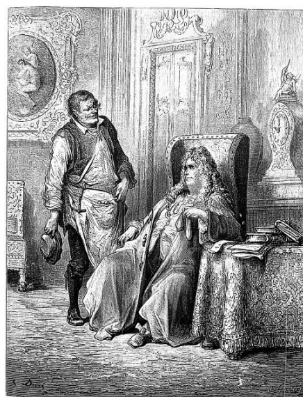
Gravure de Gustave Doré – 1867.

LA FONTAINE, Fables , VIII, 2 (1678-79).