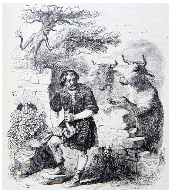
Gravure de J.-J. Grandville – 1840.

Pour récompense avait, de tous tant que nous sommes, 60 Force coups, peu de gré ; puis, quand il était vieux, On croyait l'honorer chaque fois que les hommes Achetaient de son sang l'indulgence des Dieux. Ainsi parla le Bœuf. L'Homme dit : « Faisons taire Cet ennuyeux déclamateur ; 65 Il cherche de grands mots, et vient ici se faire, Au lieu d'arbitre, accusateur. Je le récuse aussi. » [L'arbre étant pris pour juge, Ce fut bien pis encore. Il servait de refuge Contre le chaud, la pluie, et la fureur des vents ; 70 Pour nous seuls il ornait les jardins et les champs. L'ombrage n'était pas le seul bien qu'il sût faire ; Il courbait sous les fruits ; cependant pour salaire Un rustre l'abattait, c'était là son loyer ; Quoique pendant tout l'an libéral il nous donne 75 Ou des fleurs au Printemps, ou du fruit en Automne ; L'ombre, l'été, l'hiver, les plaisirs du foyer. Que ne l'émondait-on, sans prendre la cognée ? De son tempérament il eût encor vécu. L'Homme trouvant mauvais que l'on l'eût convaincu, 80 Voulut à toute force avoir cause gagnée. « Je suis bien bon, dit-il, d'écouter ces gens-là. » Du sac et du Serpent aussitôt il donna Contre les murs, tant qu'il tua la bête. On en use ainsi chez les grands. 85 La raison les offense ; ils se mettent en tête Que tout est né pour eux, quadrupèdes, et gens, Et serpents. Si quelqu'un desserre les dents, C'est un sot. J'en conviens. Mais que faut-il donc faire ? 90 Parler de loin ; ou bien se taire.]